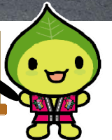
はいうえい人街ネット イメージキャラクター 『みちのこはっぴ〜くん』